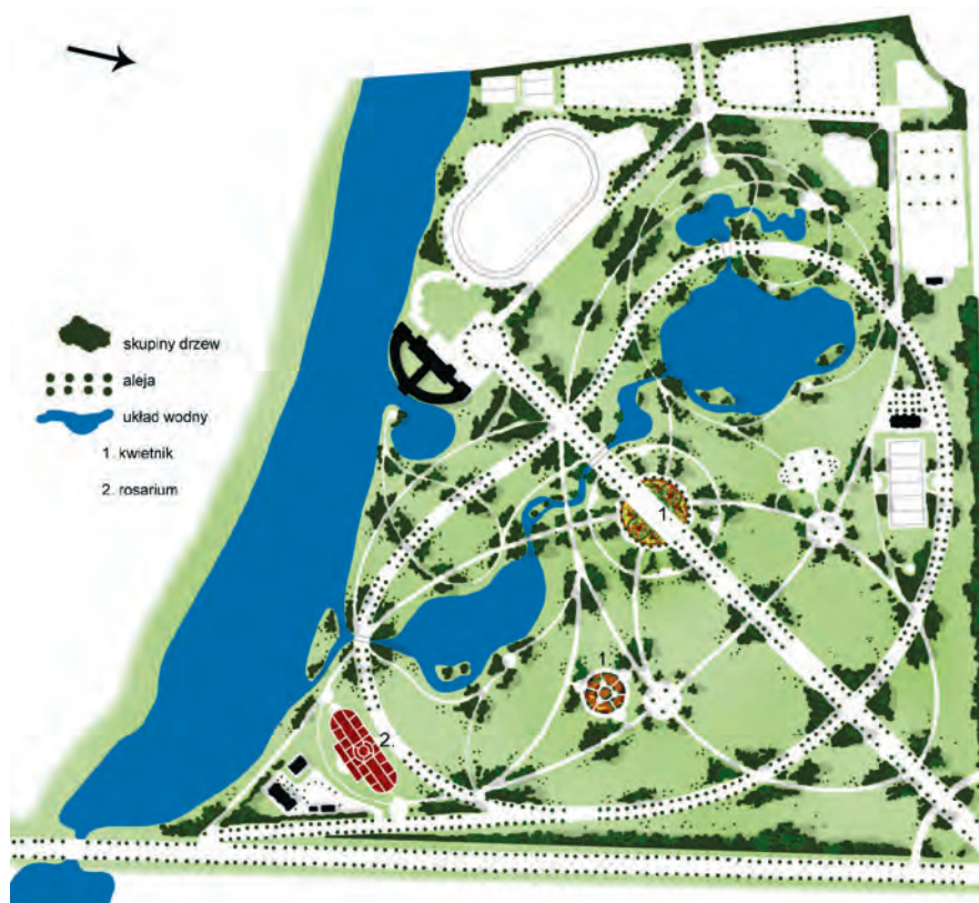
Ryc. II. 123. Park Skaryszewski w Warszawie – plan (M.R.)

Ogrody miejskie, powstające w drugiej połowie XIX wieku, w większości projektowano jako obwodnicowe. Doskonałym przykładem swobodnego układu są parki miejskie w Tarnowie, Wieliczce, park Jordana w Krakowie, park Sienkiewicza w Łodzi, parki Ujazdowski i Skaryszewski w Warszawie (ryc. II. 123., II. 124).